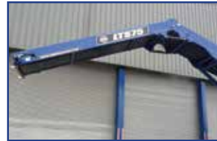
油圧式フォールドダウン