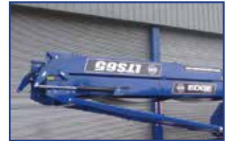
油圧式折りたたみ