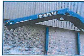
油圧式フォールドダウン