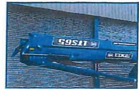
油圧式折りたたみ