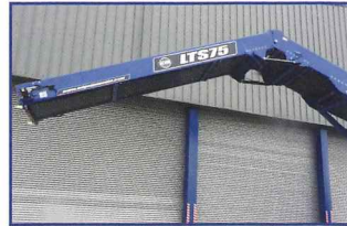
油圧式フォールドダウン