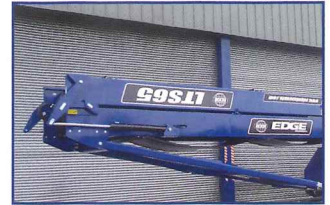
油圧式折りたたみ