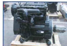
高馬力のエンジン