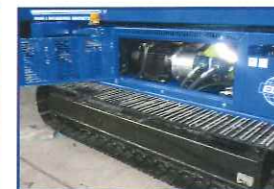
ディーゼル・電気駆動