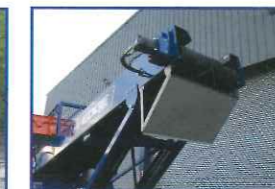
マグネットヘッドドラム