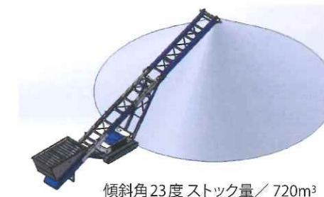
傾斜角23度ストック量 / 720m 3