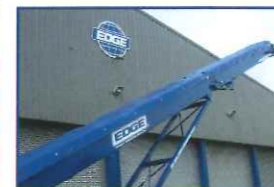
キャンバスカバー