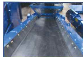
フルサイドスカート