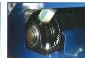
自動グリースベアリング