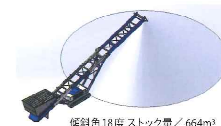
傾斜角18度ストック量 / 664m 3